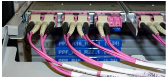
MTP-HD-Modul, LC Ports mit integrierter Staubklappe.