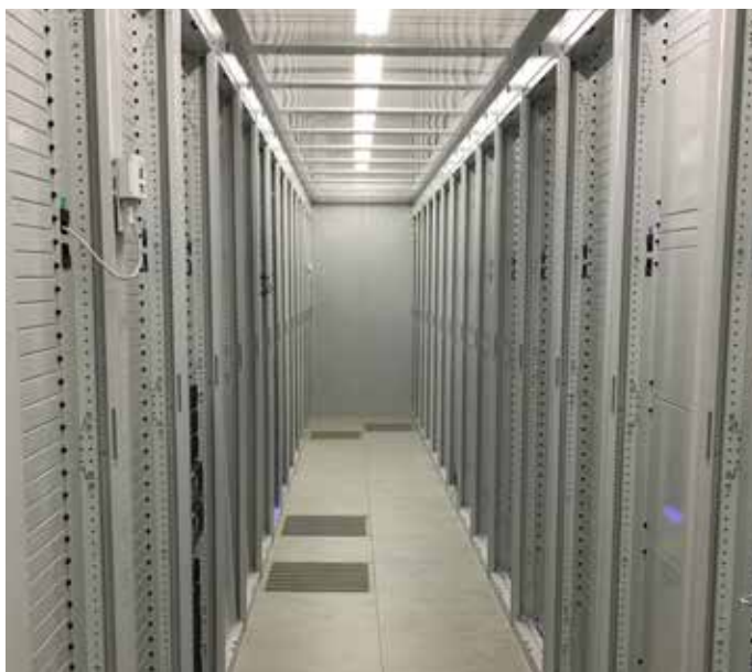
Massgeschneiderte CCM-Verkabelung für das neue Tier-III-Rechenzentrum der Atos AG.