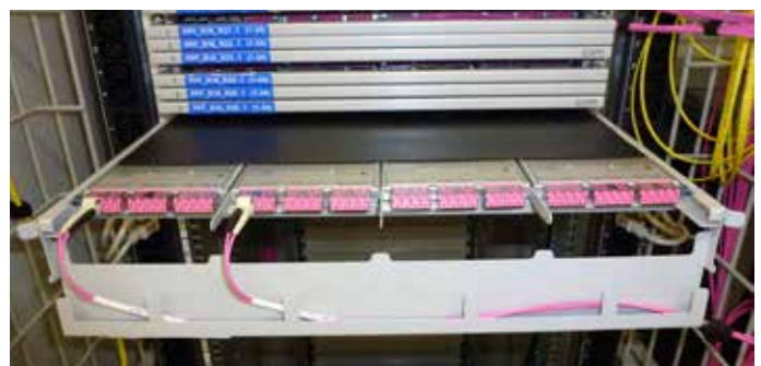
19E-MTP-HD-Modulträger mit übersichtlichem Patchkabelmanagement.

Connect Com betreibt in Hünenberg eine Glasfaser-Manufaktur, wo alle Komponenten gemäss den Anforderungen der Kunden konfektioniert werden. Hier konnte die High-Density-Lösung geprüft werden und bekam von den Atos-Praktikern Bestnoten. YDC entwickelte das Verkabelungskonzept und erarbeitete dann gemeinsam mit Connect Com die Stückliste mit den benötigten Komponenten. Die Vorkonfektionierung inklusive Testmessung wurde in der reinen Umgebung des Connect Com-Labors durchgeführt. Das erleichtert die Installation und steigert die Qualität messbar. YDC ist bekannt für sauber strukturierte Kabelführungen und akribische Dokumentation. Jedes Kabel ist unverwechselbar beschriftet – mit dem Nummernsystem des Kunden bedruckte Komponenten sind ebenfalls ein Service aus dem Hause Connect Com – und wird auf Wunsch in der eigens für diesen