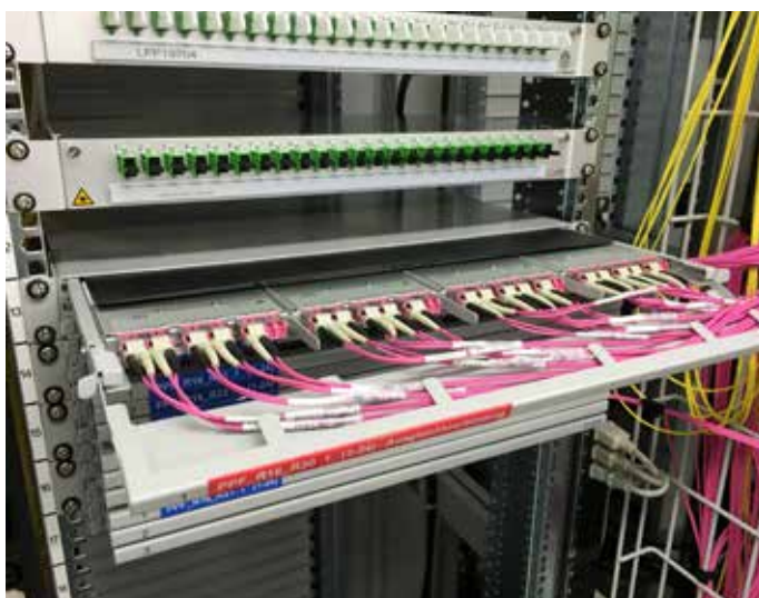
Höchste Packungsdichte dank MTP-Easy-Connect-High-Density-Lösung von Connect Com.

Der MTP HD 19"-Modulträger besteht aus drei ausziehbaren Schubladen mit einer Kapazität von je zwölf MTP-HD-Modulen. Das ermöglicht eine hohe Packungsdichte von 72 LC Ports mit 144 Fasern, 72 MTP12 Ports mit 864 Fasern bzw. 72 MTP24 Ports mit 1728 Fasern. Die Kabelführung befindet sich auf der Rückseite, zusammen mit der Schubladenmechanik führt das zu einem sehr einfachen und übersichtlichen Patchkabelmanagement.